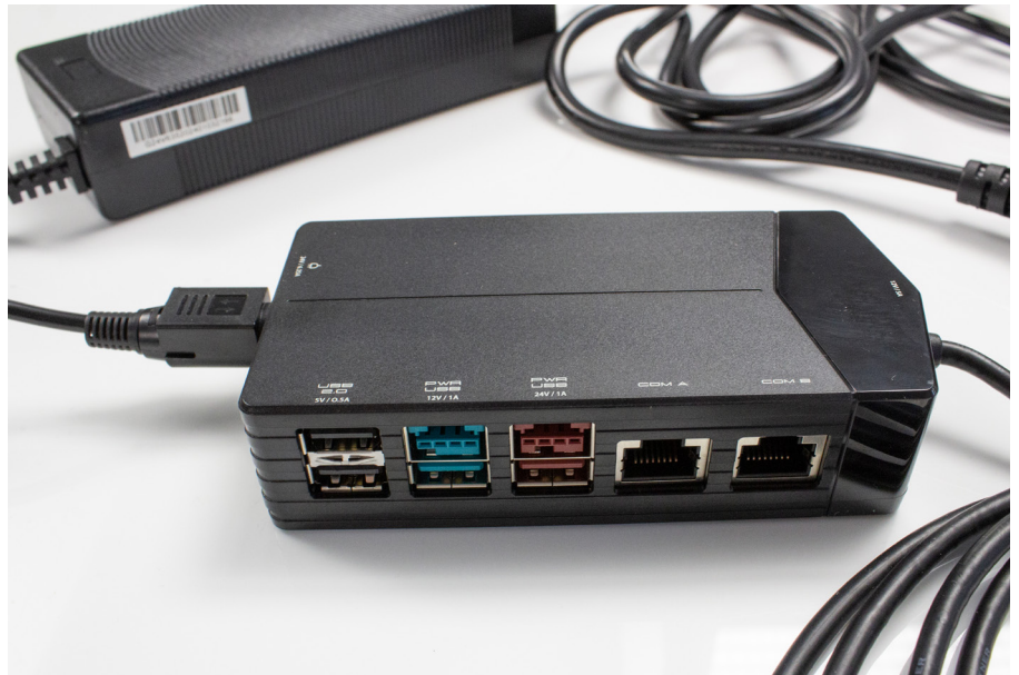
Externer IO-Hub (optional)